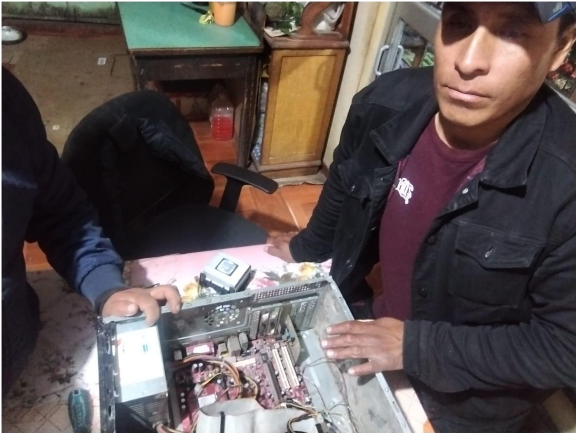
Desarrollando las clases de ensamblaje de computadoras